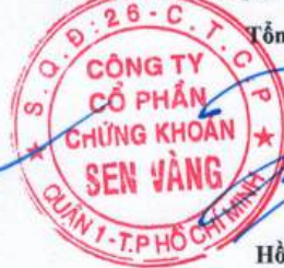
Hồ Ngọc Bạch